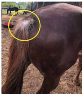
Рис. 1. Взъерошенность волосяного покрова и alopecии на репице хвоста лошади

Результаты исследований. С целью изучения распространения гельминтной инвазии проведены гельминтологические исследования у лошадей в коневодческих хозяйствах Тюменской области. Проводя осмотр животных, обращали внимание на их внешний вид, общее состояние, аппетит, волосяной покров, состояние хвоста, наличие респираторных и желудочно-кишечных расстройств в анамнезе. У некоторых животных был установлен повышенный аппетит, а упитанность при этом была ниже нормы. В области репицы хвоста наблюдались взъерошенность волосяного покрова, наличие alopecий (рис. 1). Проводя исследования соскобов с перианальных складок лошадей, были обнаружены яйца по строению идентифицированы как Oxyuris equi , ассиметричной формы, светло-серого цвета, имеющие на одном зауженном крае менее развитую оболочку, напоминающую крышечку. Интенсивность инвазии варьировалась от нескольких единиц до полусотни яиц на один грамм фекалий ИИ = 436,40 \pm 3,67 (рис. 2).